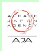
ALSACE JAPAN AGENCY