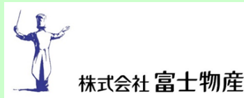
株式会社 富士物産