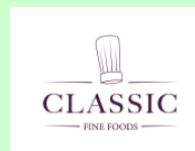
フレンチ F&B ジャパン株式会社