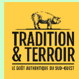
トラディション&テロワール