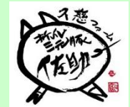
久慈ファーム有限会社